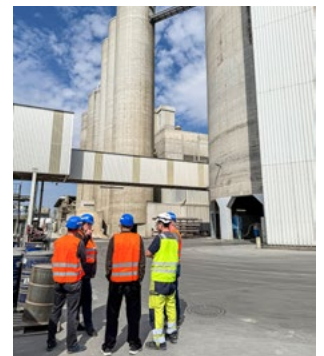
Klinker- und Zementsilos

In Rummelsburg wird neben anderen genormten Qualitäten hauptsächlich Portlandzement hergestellt, der eine lange Tradition und seine Wiege in Karlshorst hat. Dort wurde erstmals ein Standard für Zement zum Bauen festgelegt. Hier sei auf das Portland-Cement-Haus in der Dönhoffstraße 39 verwiesen. Das Gebäude war früher das erste