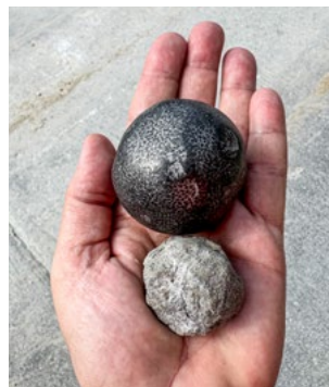
Mahlkörper aus Stahl (groß), Klinker (klein)

von Beton bei. Doch wie entsteht Zement? Gestein zerkleinern (z. B. auch Kalkstein aus Rüdersdorf), brennen, mahlen, mischen, fertig! Naja, ganz so einfach ist es nicht und es ist ein energieintensiver Prozess, weil die Klinker gebrannt und bei 105 Grad gemahlen werden. Je nach Mischung der in der Mühle zerkleinerten und zerriebenen gebrannten Klinker mit Hüttensand, Asche oder Gips entstehen unterschiedliche Qualitäten. Diese weisen unterschiedliche Festigkeiten oder Fließfähigkeiten auf. Auch gilt als Faustformel: je kleiner die Klinker gemahlen werden, desto größer ist die Festigkeit und je höher der Wasserbedarf, um den Zement zu verarbeiten. Selbstverständlich erfolgt eine permanente Qualitätskontrolle durch das Labor. Auch der Verband der Zementindustrie VDZ kontrolliert die Produktion und Dokumentation.